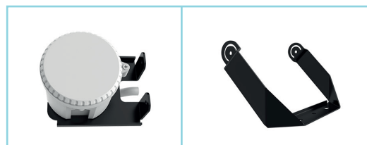
Capteur de mouvement