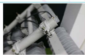
Assemblage facile et connexion rapide de chaque pièce