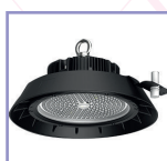
Capteur de luminosité