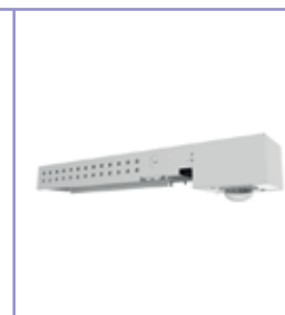
Capteur de mouvement