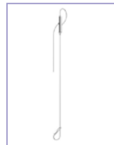
Câble de suspension