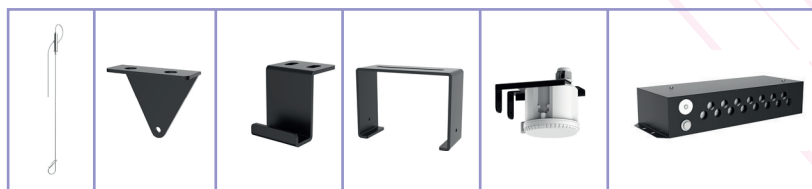
Câble de suspension