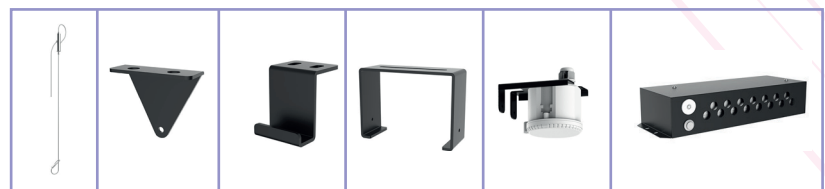
Câble de suspension