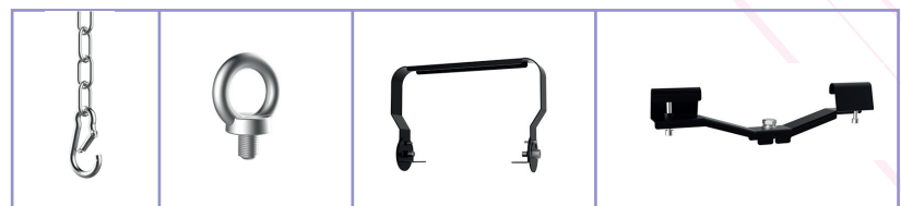
Anneau à visser